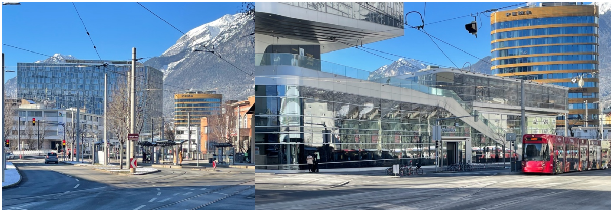
Turm1 und 2 aus dem stadteil pradl gesehen

der Beitrag zum Gemeinwesen werden, zeigt sich jedoch als Wettbewerbsgimmick für welches bis heute keinerlei Nutzung gefunden werden konnte.