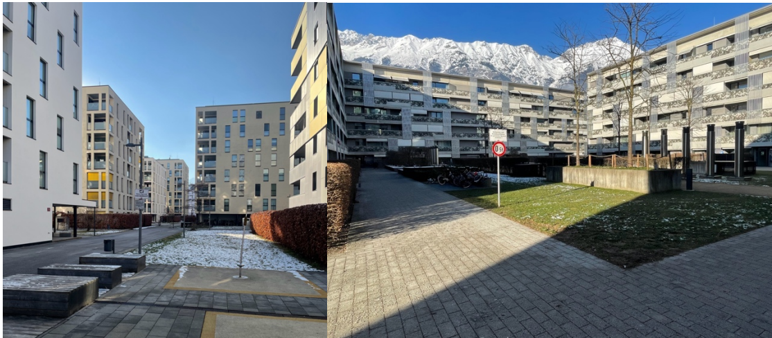
O3 (Reitter, DIN A4)