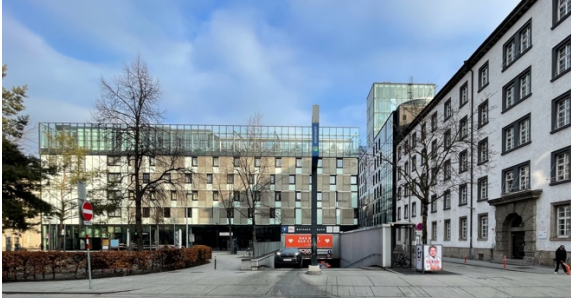
Rathaus mit Hotel, Turm, Altbestand

Das ikonografische highlight aus dieser Zeit ist zweifellos die Berg Isel Sprungschanze von Zaha Hadid, welche 1999 aus einem geladenen Wettbewerb als Siegerin hervorgegangen ist. Dass dieses Projekt und nicht ein reiner betonfunktionsbau eines Schanzenspezialisten des ÖSV zur Ausführung kam kann wieder dem Bürgermeister zugerechnet werden.