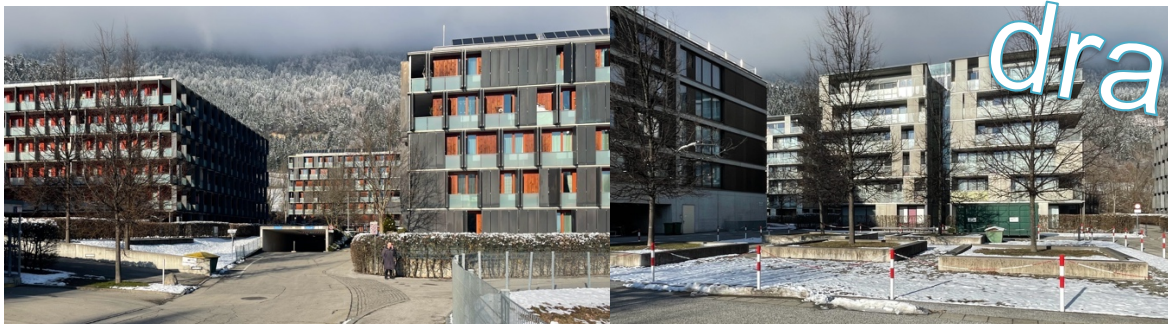
2 phasen Baumschlager Eberle

Die zweite Phase Lohbach unterlag offenbar Sparmaßnahmen, jedoch kann auch der architektonische Ansatz von Driendl Architekten nicht an die Qualität der ersten Generation heranreichen.